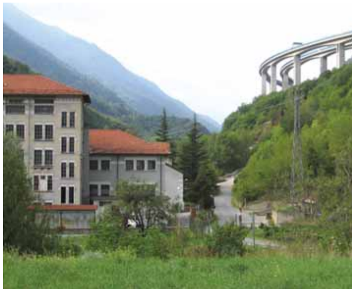
Chiomonte, Colombera: la centrale idroelettrica e il viadotto dell'autostrada del Frejus