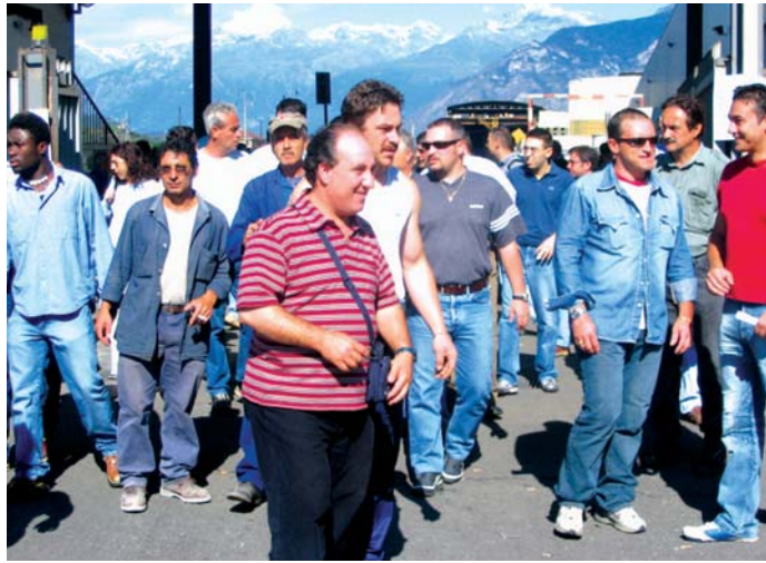
I lavoratori dell'acciaieria in sciopero

Open Music Festival, Adelaide suona il rock (e non solo)