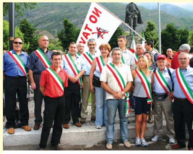
I sindaci della Valle manifestano

E se alla fine a forzare i presidi contro i sondaggi provvedesse il Generale Agosto? Tutti (o quasi) in ferie. La politica in vacanza. I giornali (almeno quelli locali) fermi per la pausa estiva. La tensione che, per forza di cose, diminuisce. Dopo il "no, grazie" dei sindaci valsusini alle proposte della Commissione Intergovernativa (che di fatto ha detto alla moratoria di tre mesi chiesta dagli enti locali), il timore sembra essere proprio questo.