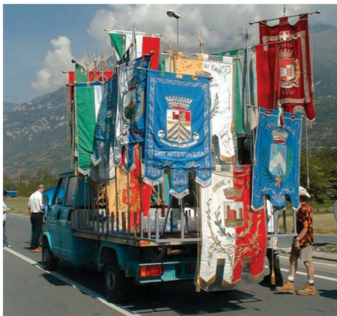
I gonfaloni dei Comuni valsusini alla marcia del 31 maggio 2003

Una raffica di consigli comunali contro l'alta velocità ferroviaria Torino-Lione. Succederà sabato 19 marzo, dalle 10 del mattino alle 16 del pomeriggio, in piazza Castello, nel cuore di Torino. In tutto quaranta consigli comunali dei territori interessati dal progetto della nuova linea, che dureranno, ciascuno, dieci minuti. Il tempo di sedersi, fare l'appello, leggere l'ordine del giorno concordato, approvarlo e lasciare spazio al consiglio successivo. Inizierà Bussoleno alle 10 in punto, seguito dai Comuni della Valmessa e poi, via via, tutti gli altri. E non ci saranno solo sindaci in fascia tricolore, consiglieri comunali, presidenti e consiglieri delle comunità montane, vigili urbani con i gonfaloni. La pattuglia